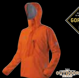
Felsturm Jacket Men