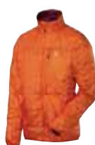
Barrier Pro Jacket orange rush