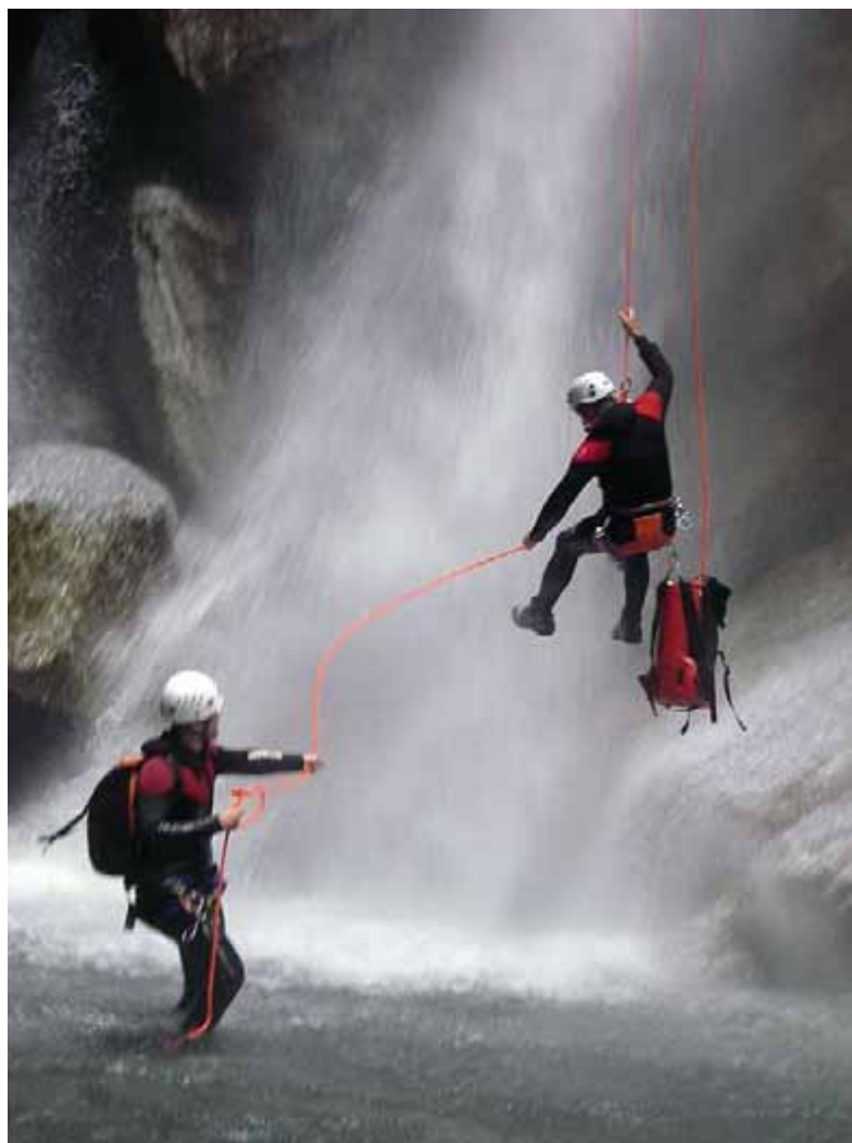
Spektakuläres Abseilen in der Iragna

Wollen Sie allein oder unter Freunden eine private Bergtour mit grösst möglicher Sicherheit erleben? Haben Sie ein Wunschziel oder möchten Sie sich beraten lassen? Dann rufen Sie uns an oder senden Sie ein E-mail. Wir organisieren Ihr Vorhaben professionell.