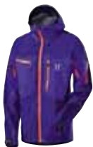
Topp Jacket abyss blue/meso blue

ACE alpine & climbing equipment AG, Postfach, 8873 Amden, Tel. 055 611 61 61