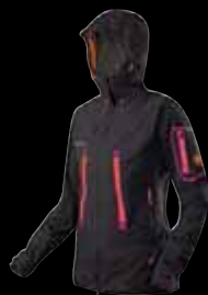
Mittellegi Jacket Women