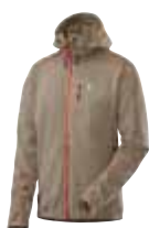
Bungy Zip Hood tungsten