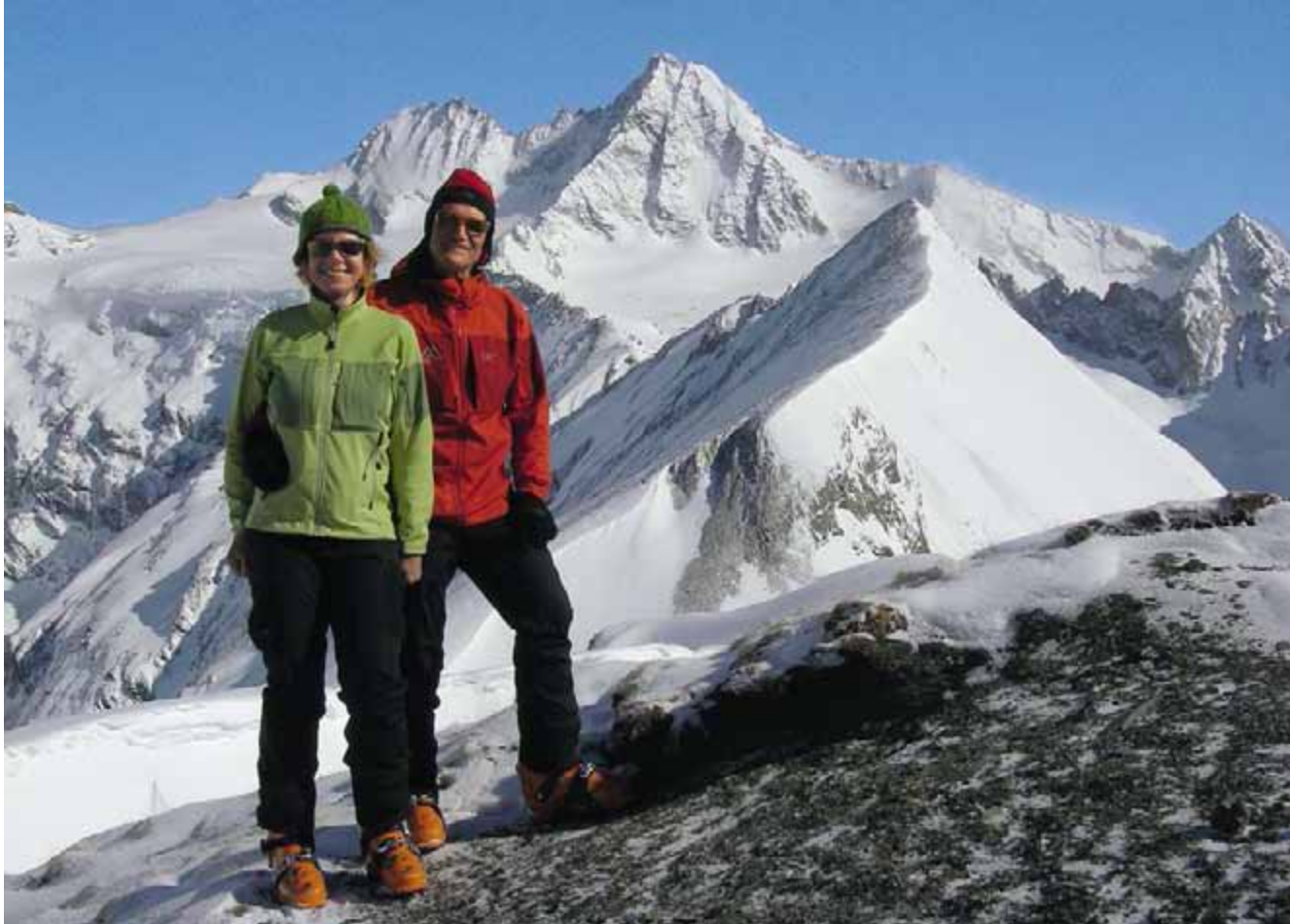
Auf dem Gipfel des Figerhorns mit Hintergrund Grossglockner